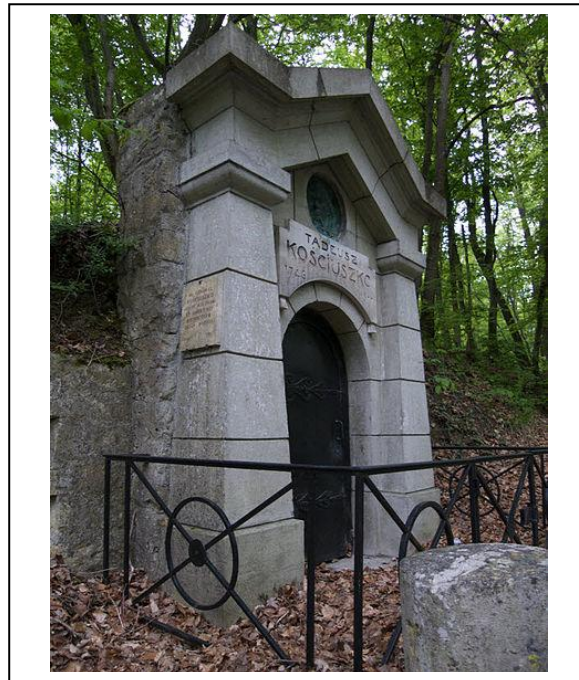
Ci-dessus, le monument dédié à Kościuszko en forêt de Fontainebleau.