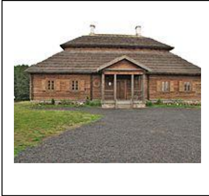
Maison natale de Kościuszko à Mereczowszczyzna Statue du héros à Varsovie.

Kosciuszko est mort à Soleure, en Suisse, en 1817.